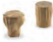
CHEF ONE - COOK ONE