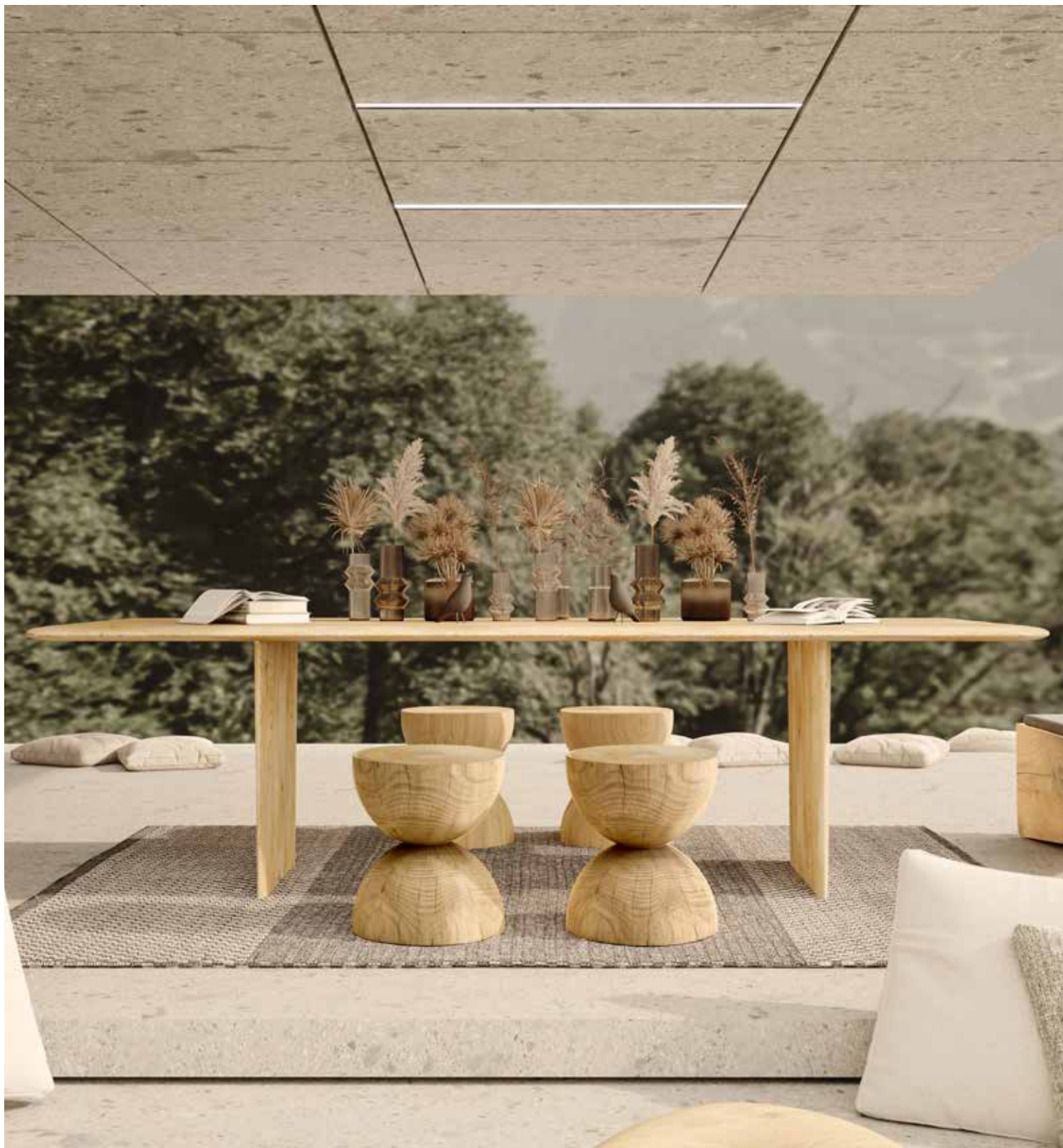
CM: L. 200/220/240/260/280/300 · P. 100 · H. 75