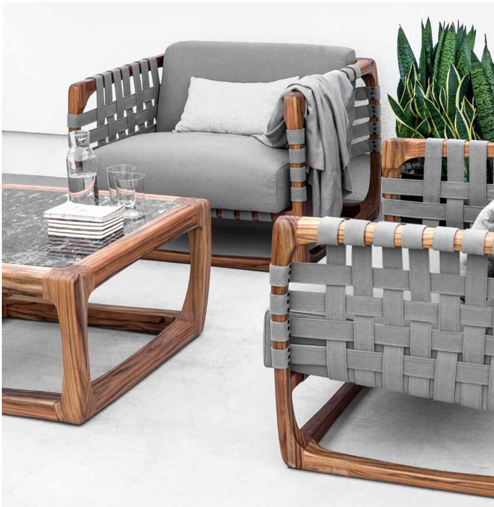
BUNGALOW ARMCHAIR Poltrona · Armchair · Sessel design by Jamie Durie