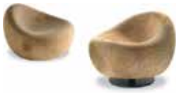
MAUI pag. 4