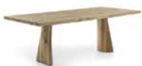
SOLID SWING OUTDOOR