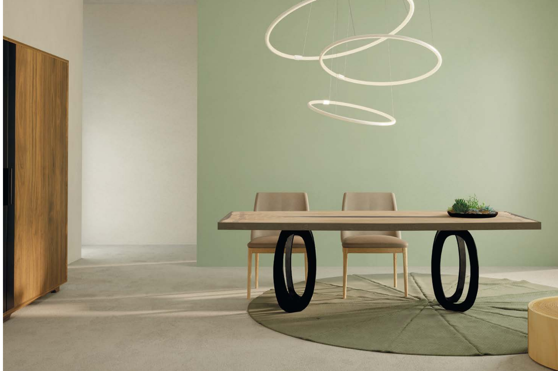
HYPNOTIC Tavolo - Table design by Authentic Design