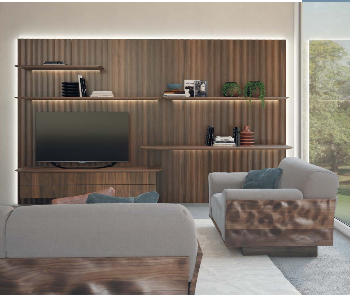
MODULA Boiserie design by C.R.&S. Riva1920